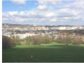
Aussicht Roter Berg