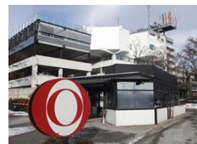
ORF Zentrum am Königberg