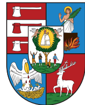
Wappen von Hietzing