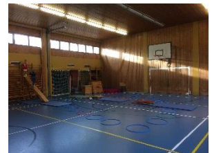
Turnen und Sport