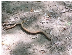
Blindschleiche im Lainzer Tiergarten