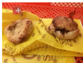
Ober St. Veit Grätzlfest